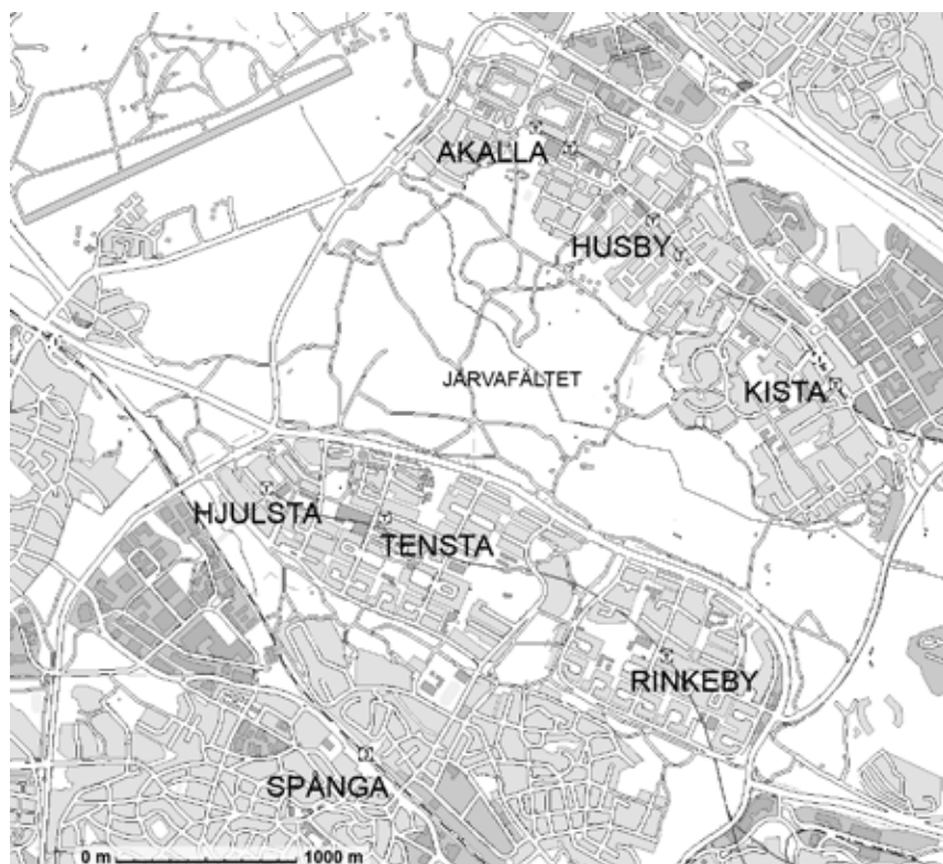
Järva-Spånga-området. Karta © Stockholms Stad.

städer världen över. Begrepp som divided eller dual cities används frekvent inom den internationella forskningen för att beskriva denna trend mot ökade sociala skillnader (se ex. Harvey 2001, 367). ”Delningen” hänvisar till en på samma gång social och rumslig uppdelning. Även i Sverige talas om delade städer (se Magnusson et al 2001; SOU 1997), men oftast sammanfattas den kombinerade rumsliga och sociala polariseringen, både i den offentliga debatten och inom forskningen, under begreppet segregation. Den utveckling mot ökad social polarisering och segregation som skett internationellt känns igen också i Stockholm. Sedan 1990-talet har stadens marknadsorientering blivit allt mer påtaglig även inom bostadssektorn där det privata kapitalets inflytande stärkts. I Stockholms innerstad har koncentrationen av en resursstark befolkning vuxit under många år, även den traditionella arbetarklasstadsdelen Södermalm har genomgått en process av