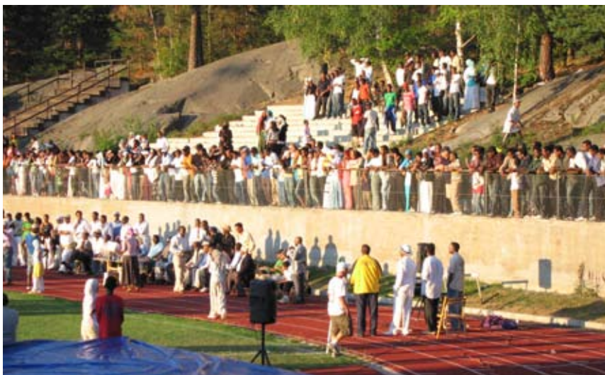
Bilder från Somaliska veckan 2005, Sundbybergs IP.