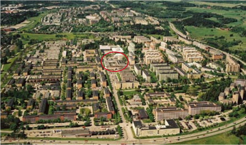
Rinkeby i vy mot nordväst, med centrum inringat. I bakgrunden syns Tensta och Hjulsta. Karta © Stockholms Stadsbyggnadskontor.