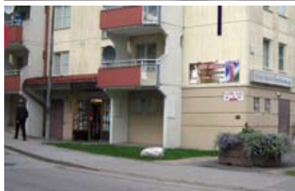
Småbutiker i Rinkeby.

Småbutikerna är, med några få undantag, lokaliserade i omvandlade eller ombyggda gemensamhetslokaler såsom förråd, tvättstugor, hobbyrum, uthyrningslokaler eller garageutrymmen. Gemensamt för småbutikerna är att de antingen är lokaliserade intill en gata eller en gångbana samt att de i de allra flesta fall upptar en plats vid bostadshusens kortsidor. Detta har troligtvis sin förklaring i att dessa lägen är synliga och lättillgängliga samt att entréerna till gemensamhetslokalerna ofta är placerade här.