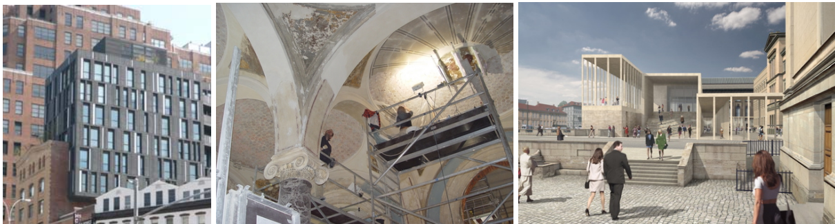
"Parasit"-, restaurerings- och kontexttillägg.

Det är ett primärt intresse för SFV att informera, presentera och levandegöra slottets historiska byggnader, exteriört och interiört samt gårdarna och vallarna på slottsholmen. Anläggningen har kapacitet för utökade aktiviteter genom utveckling av existerande verksamheter och nya evenemang. Detta kan ytterligare öka intresset för slottet och möta det växande behovet från kulturturism i regionen. Historiskt är Malmöhus starkt förbundet med staden. Underhand som staden vuxit ut har balansen i detta samband förändrats. Även slottets kontakt med havet har successivt gått förlorad genom omfattande utfyllnader och nybyggnader i hamnområdet. Idag är det svårt för en oinvigd betraktare att förstå anläggningens läge vid sundet. Målet är att detta förhållande bör förtydligas genom information, tillgång till skyttevåningens utsikt och genom att framtida planering kan öka slottets kontakt med vattnet.