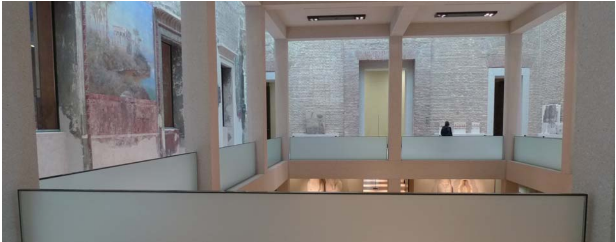
Ny arkitektur möter historisk miljö, Neues museum, Berlin av arkitekt David Chipperfield, London