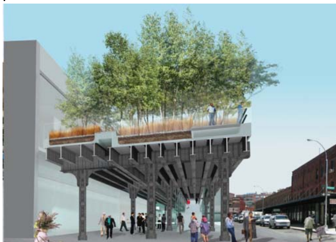
Malmöhusvågen, vallarna och parkeringen är viktig att förädla. Ex Highline, New York, DS+R.

Fastighetsverkets nya vårdprogram föreskriver att kulturhistoriska värden vid Malmöhus förädlas och levandegörs med aktiviteter som avpassas det regionala museets olika funktioner. Behovet av förnyelse är nödvändig för att möta publikens krav och önskemål om ett välkommande, öppet, överblickbart och orienterbart museum med attraktiva samlingar och interaktivitet . Behovet av program och aktiviteter i samband med utställningarna; guidade visningar, video presentation, interaktiv screen vid objekten stimulerar besökarens förmåga att ta in utställningen, gör besöket roligt och händelserikt, väl värt ett återbesök.