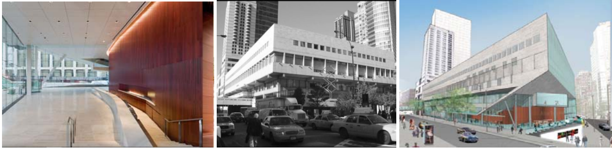
Diller, Scofidio + Renfros ombyggnad av Julliard School, New York upplöser den gamla byggnadens slutenhet och låter verksamheten samspela med gatan och omgivningen.