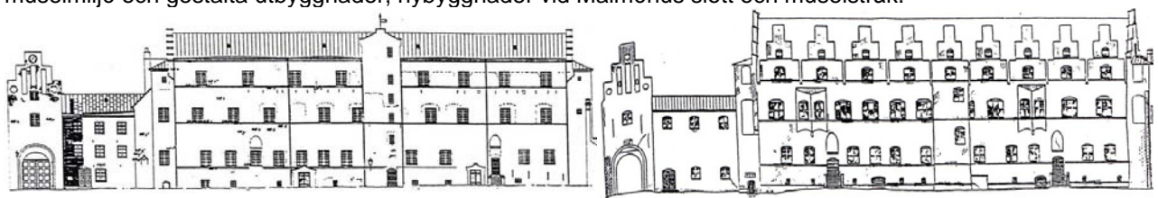
Borggårdsfasaden före och efter restaurering 1928-32.

Statens fastighetsverk har till det nationella kulturarvet (de kungliga slotten, riksfästningarna, residensen mm) knutit till sig mer än 40 sk slottsarkitekter och husarkitekter som garanterar designkvalitet och projekteringskompetens. Denna "slottsarkitektkurs" ger dig möjligheter att utveckla kompetens. Du får möta privatpraktiserande slottsarkitekter och internationella experter som pratar om den dynamiska kulturmiljön. I projektstudierna utvecklar du kompetens att undersöka, analysera och projektera en stor, komplex byggnadsuppgift med särskilda krav på dialog mellan samtidens behov och värdena i den kulturhistoriska miljön. Du väljer mellan sex olika specifika uppgifter; kreativ restaurering, ombyggnad av museimiljö och gestalta utbyggnader, nybyggnader vid Malmöhus slott och museistråk.