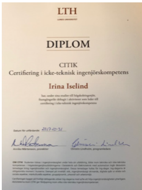
Fig. 2. Diplom certifiering CITIK